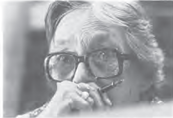
Marguerite Duras, en 1985.

www.comedie-francaise.fr/biographies/duras.htm